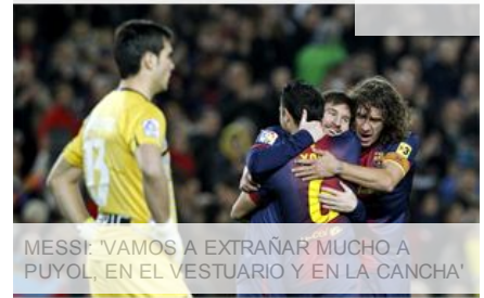
MESSI: 'VAMOS A EXTRAÑAR MUCHO A PUYOL, EN EL VESTUARIO Y EN LA CANCHA'